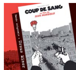
Coup de sang (2006)